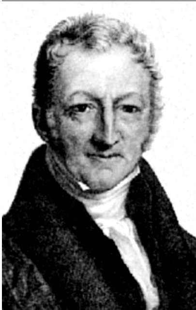
Figura 1. Thomas R. Malthus (1766-1834) e Richard von Krafft-Ebing (1840-1902)

In generale, all'inizio degli anni Novanta, erano chiari alcuni concetti a livello scientifico e di opinione pubblica: già si parlava di sviluppo sostenibile; nel 1992