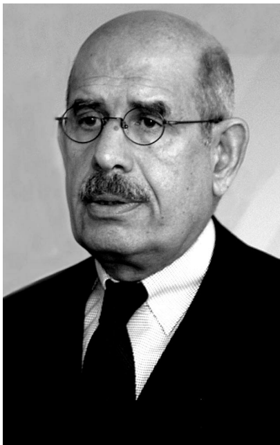
Figura 3. Mohamed El Baradei e, sotto, il Premio Nobel Al Gore

È la conclusione di un'epoca, definita dagli studi sull'effetto Larsen, dalle annotazioni drammatiche di Nab Ki Moon. Il segretario generale delle Nazioni Unite